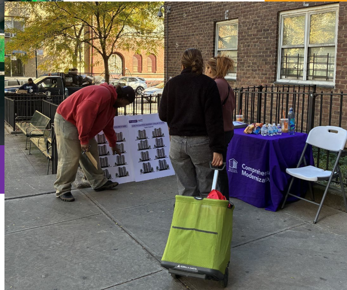
Mesa de Encuesta con Rayas de Colores Acentuados Octubre 14, 2025