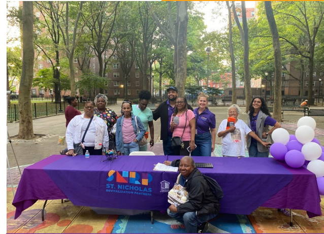
Noche de Bingo Septiembre 19, 2024