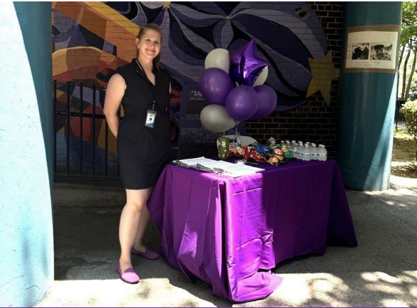
Gran Inauguración de la Oficina Junio 18, 2024