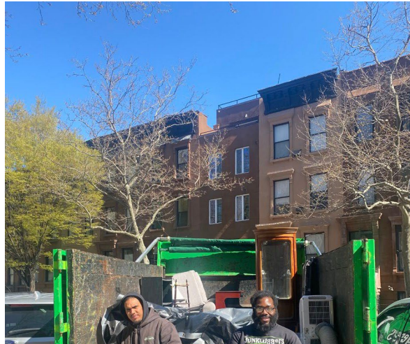
Día del Contenedor Abril 17, 2025