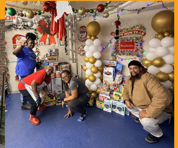
Recolección de juguetes de San Nicolás Diciembre 19, 2025