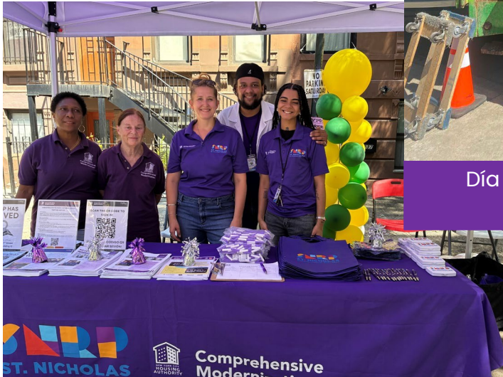
Día de la Familia de San Nicolás Agosto 23, 2025